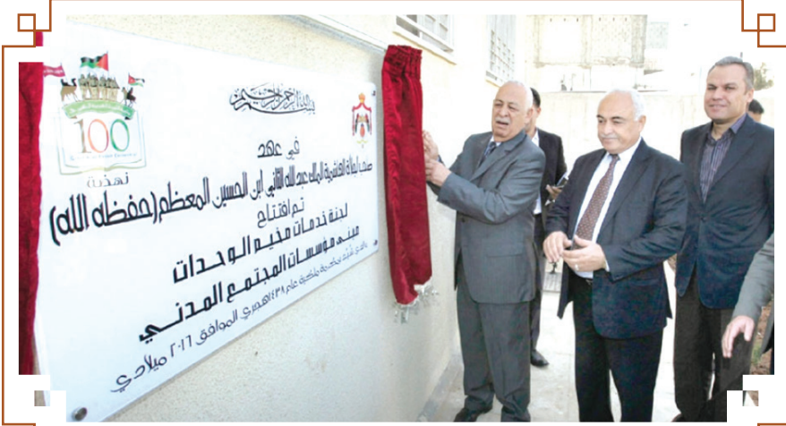
معالى أمين عام الديوان الملكي يفتتح مبنى مؤسسات المجتمع المدني في مخيم الوحدات