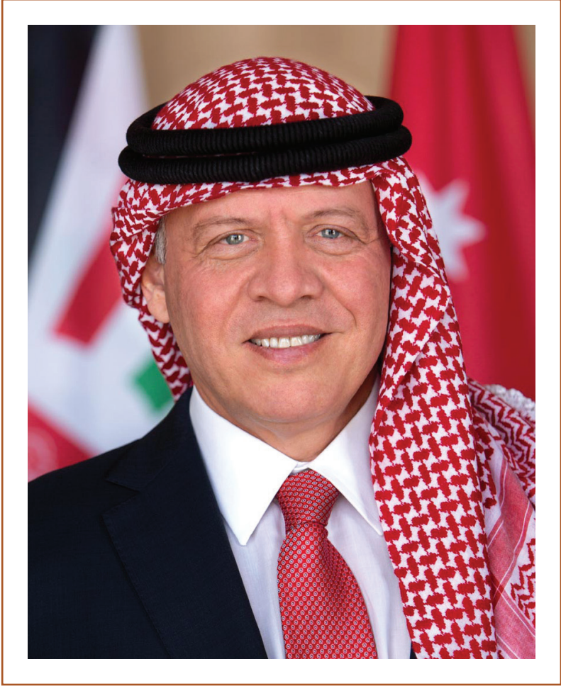
حضرة صاحب الجلالة الهاشمية الملك عبد الله الثاني ابن الحسين المعظم ملك المملكة الأردنية الهاشمية