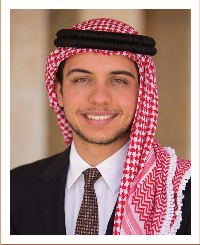
حضرة صاحب السمو الملكي الأمير الحسين بن عبد الله الثاني ولي العهد المعظم