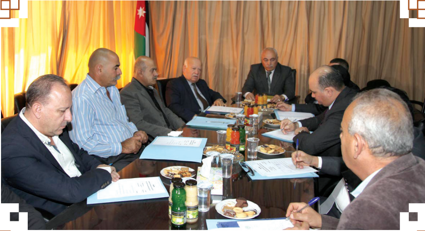
الاجتماع التنسيقي للدول العربية المضيئة للاجئين الفلسطينيين

هذا الى جانب ما تقوم به الدائرة على صعيد متابعة تنفيذ برامج توزيع المساعدات المباشرة كل ثلاثة أشهر في اطار برنامج الإغاثة والخدمات الاجتماعية التابع لمكتب الأونروا الإقليمي في الاردن والموجه للاجئين الفلسطينيين في كافة محافظات المملكة .