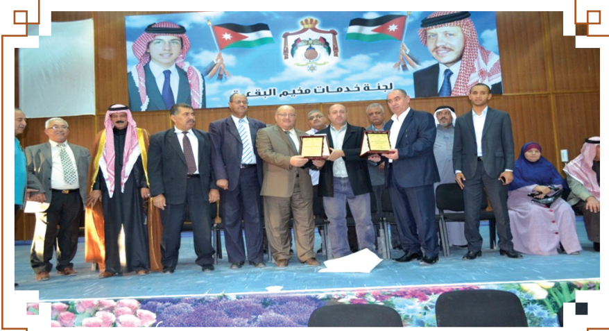
زيارة لجنة خدمات مخيم طولكرم