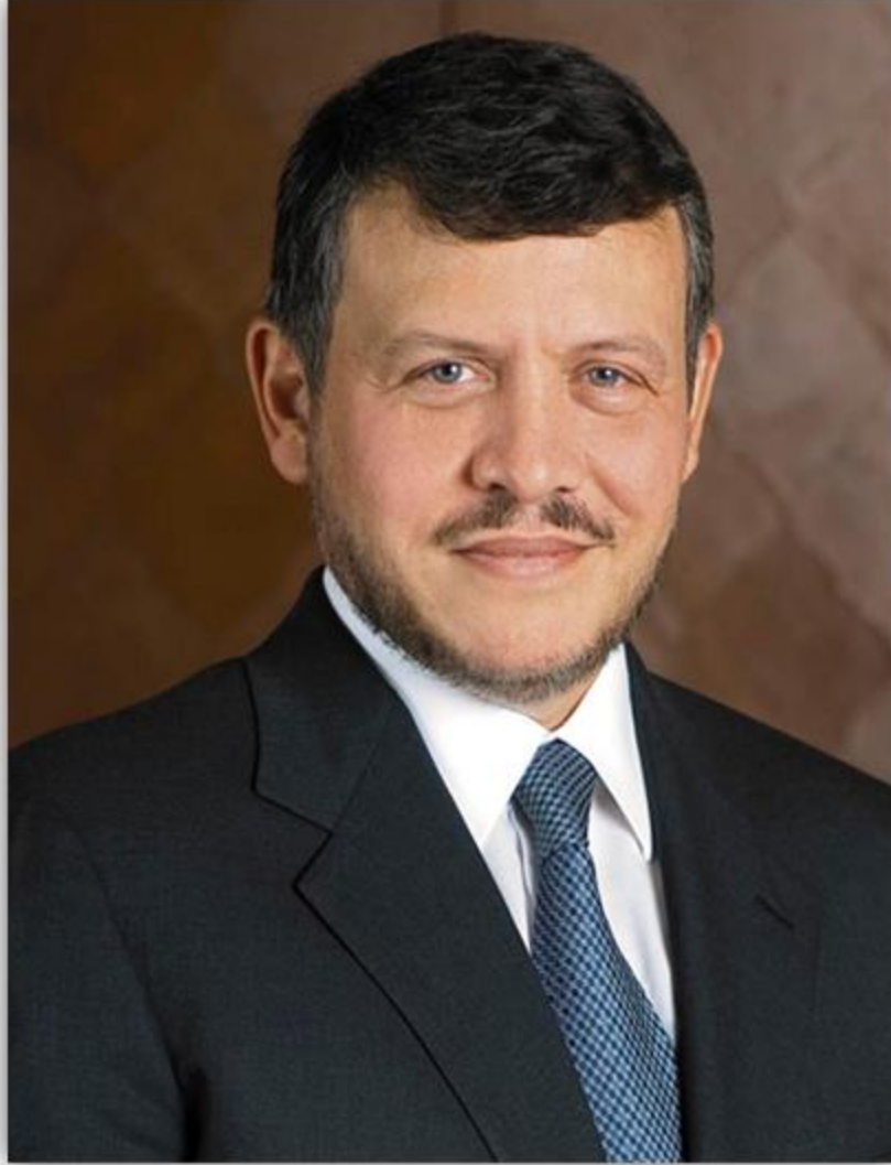
حضرة صاحب الجلالة الهاشمية الملك عبد الله الثاني ابن الحسين المعظم