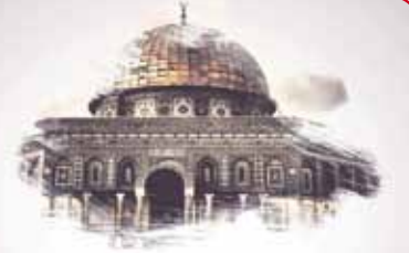
القدس .. عاصمة فلسطين